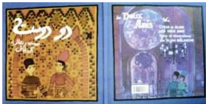
Les deux amis

perspective s'accomplit et les faîtes des étages donnent relief au prisme que constitue l'édifice. L'ornementation de l'époque ajoute à la rigueur toute la grâce du travail du métal. On comprend mal aujourd'hui que l'on ait pu dire « l'odieuse colonne de tôle boulonnée » Par comparaison avec la rigueur glacée des édifices de verre de la Défense ou de Montparnasse, l'aspect de la Tour Eiffel garde un côté manuel dans cette immensité technique."