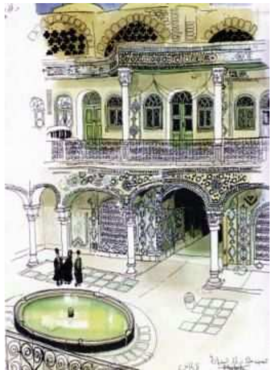
Le bazar d'Ispahan

Les trois cheveux d'or (Seh tâ mou-ye talâ'i), publié à Téhéran en 2000, est un conte persan, dans la plus pure tradition des contes de fées. Il met en scène un roi qui se perd dans la forêt alors qu'il est à la chasse. Hébergé dans l'étable d'une famille de paysans la nuit même où la femme de la maison met au monde un garçon, il entend les fées prédire que cet enfant épousera la fille du roi. De retour chez lui, il apprend que sa femme a mis au monde une petite fille. Il fera tout pour empêcher que la prophétie des fées se réalise. Il essaiera en vain de faire tuer le garçon puis lui confiera une mission quasiment impossible à réaliser, mais le garçon, aidé par les fées, saura surmonter toutes les difficultés pour la mener à bien. Puis il épousera la fille du roi.