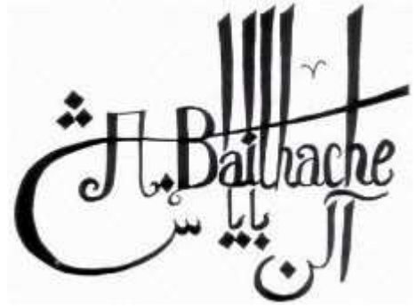
Signature d'Alain Bailhache