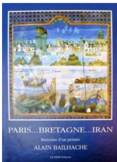
Paris Bretagne Iran